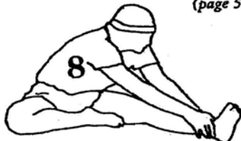
30 seconds each leg (page 36)