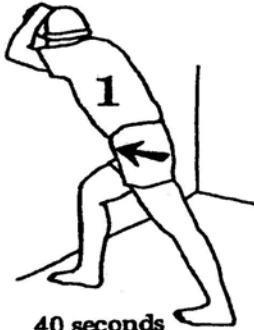
40 seconds each leg (page 71)