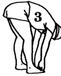
30 seconds (page 52)