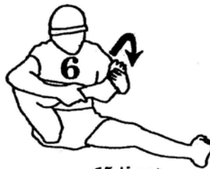
15 times each direction (page 31)