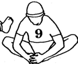
40 seconds (page 56)