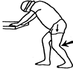
15 seconds each leg (page 71)