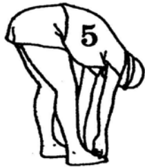
30 seconds (page 52)