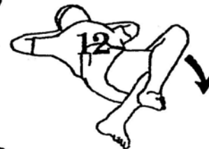
25 seconds each side (page 24)