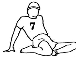
30 seconds each leg (page 33)