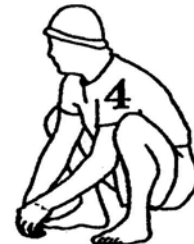
20 seconds (page 65)